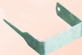
Pletina Acero Galvanizado (PL)