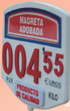
Base Portaprecios Med: 82 x 75 mm.