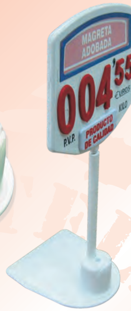
Varilla Alargadora Med: 220 x 7 mm.